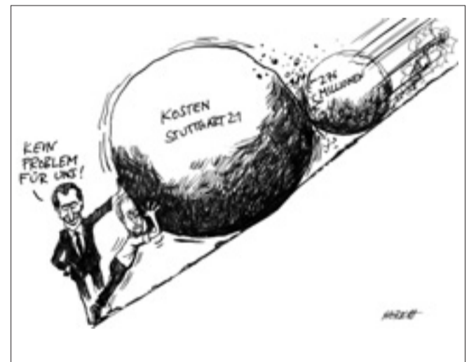
„Man muss sich Sisyphus als glücklichen Menschen vorstellen“: Die Kostendebatte um Stuttgart 21 holt Stadt und Land ein. Oettinger legt Millionen nach. Karikatur: Horsch