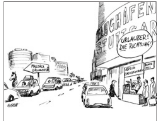
„Der Ballermann nach Baden muss – der Oetti gibt den Zerberus“: Oettinger verweist im Streit um den Flughafen-ausbau Urlauber zum Baden-Airport. Karikatur: Horsch