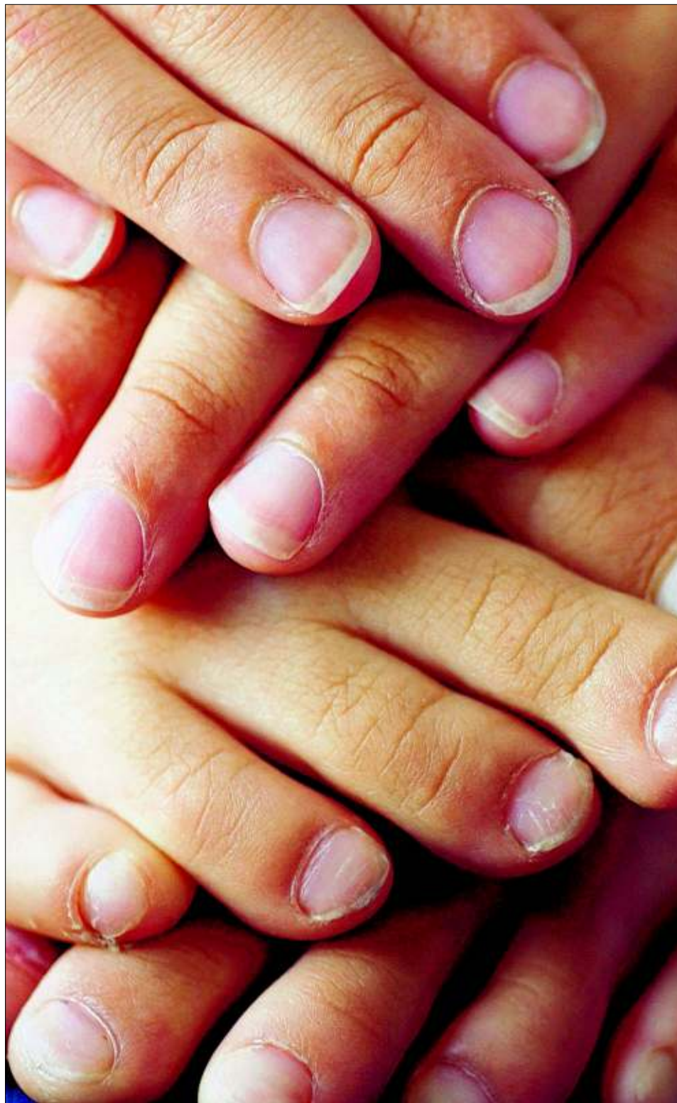
Verraten Fuß und Hand mehr als Äußerlichkeiten? Dahlke sagt: Ja.

Sogenannte Full Rocker ähneln der Form nach einer auf dem Rücken liegenden Banane. „Im Tiefschnee schwimmt der Ski wie ein Surfboard und kommt so leichter ins Gleiten“, sagt König. Die aufgebogene Schaufel soll verhindern, dass die Spitze in den Schnee eintaucht. Manche Full Rocker sind auch hinten gebogen – theoretisch könnte man also sogar rückwärts fahren. Allerdings: „Der Full Rocker ist ein reiner Tief-